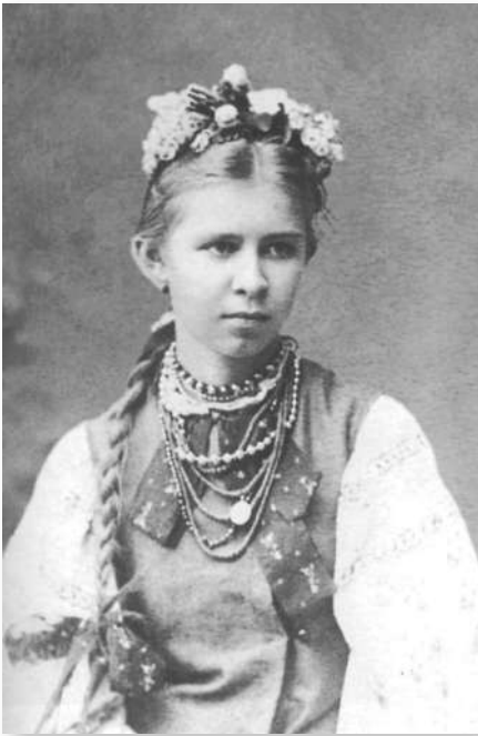
Леся Українка. 1886 р.

баронеси. Софія вийшла на веранду. “Вона всміхнулась, звернула погляд з тихою мрією на широку алею, що мов річка лисніла при місячному сяйві. З тремтячої темряви лунав соловйовий спів. Софія знов усміхнулась <...>” [10, 87].